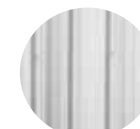
SAC & METAL